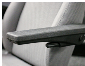
Basic Kunststoffcover, Integralschaumauflage (optional bezogen), Drehrad Plastic cover, integral foam cushion (optionally fabric covered), rotary wheel