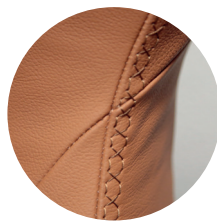
Kapp- , Ziernähte, Keder Seams, decorative seams, pipings