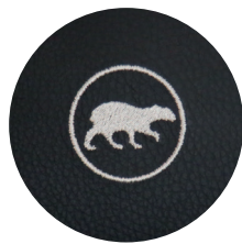
Individuelles Logo gestickt / geprägt Individual logo embroidered / embossed