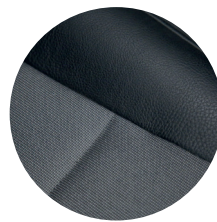
Leder, Stoff oder Kombination Leather, fabric or half-leather